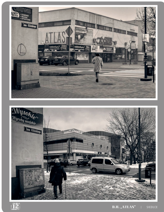
D.H. „ATLAS” | SIEDLCE